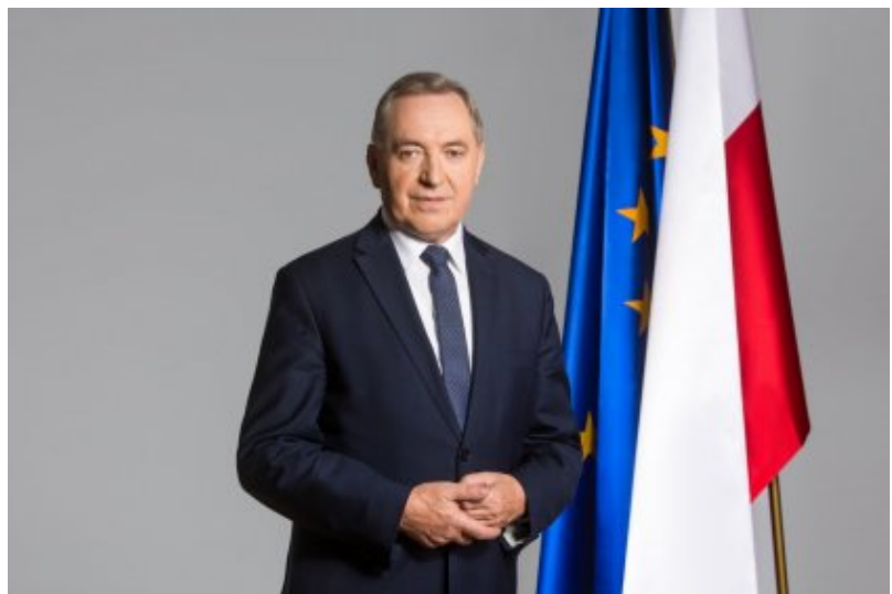
Henryk Kowalczyk, Minister