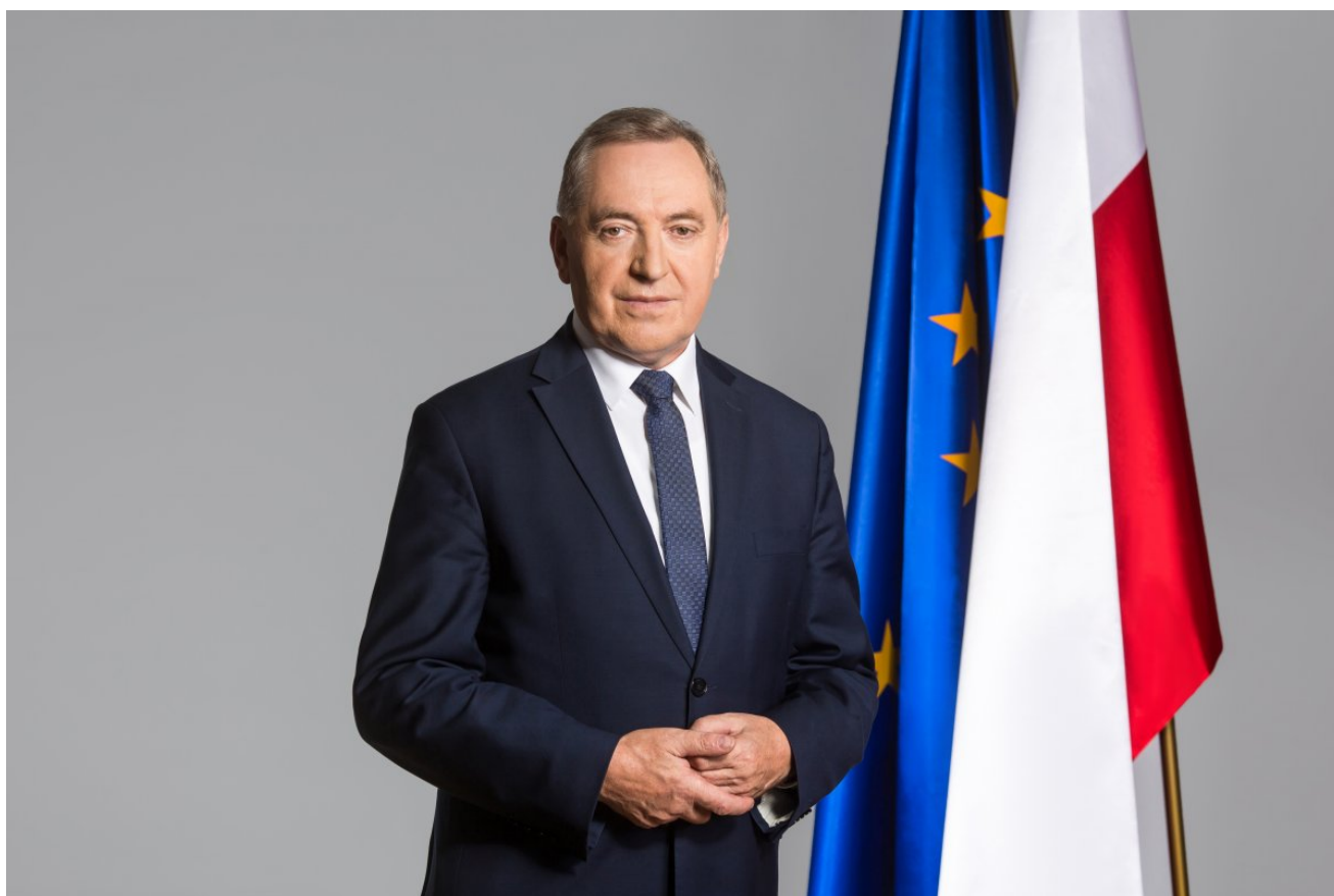
Henryk Kowalczyk, Minister